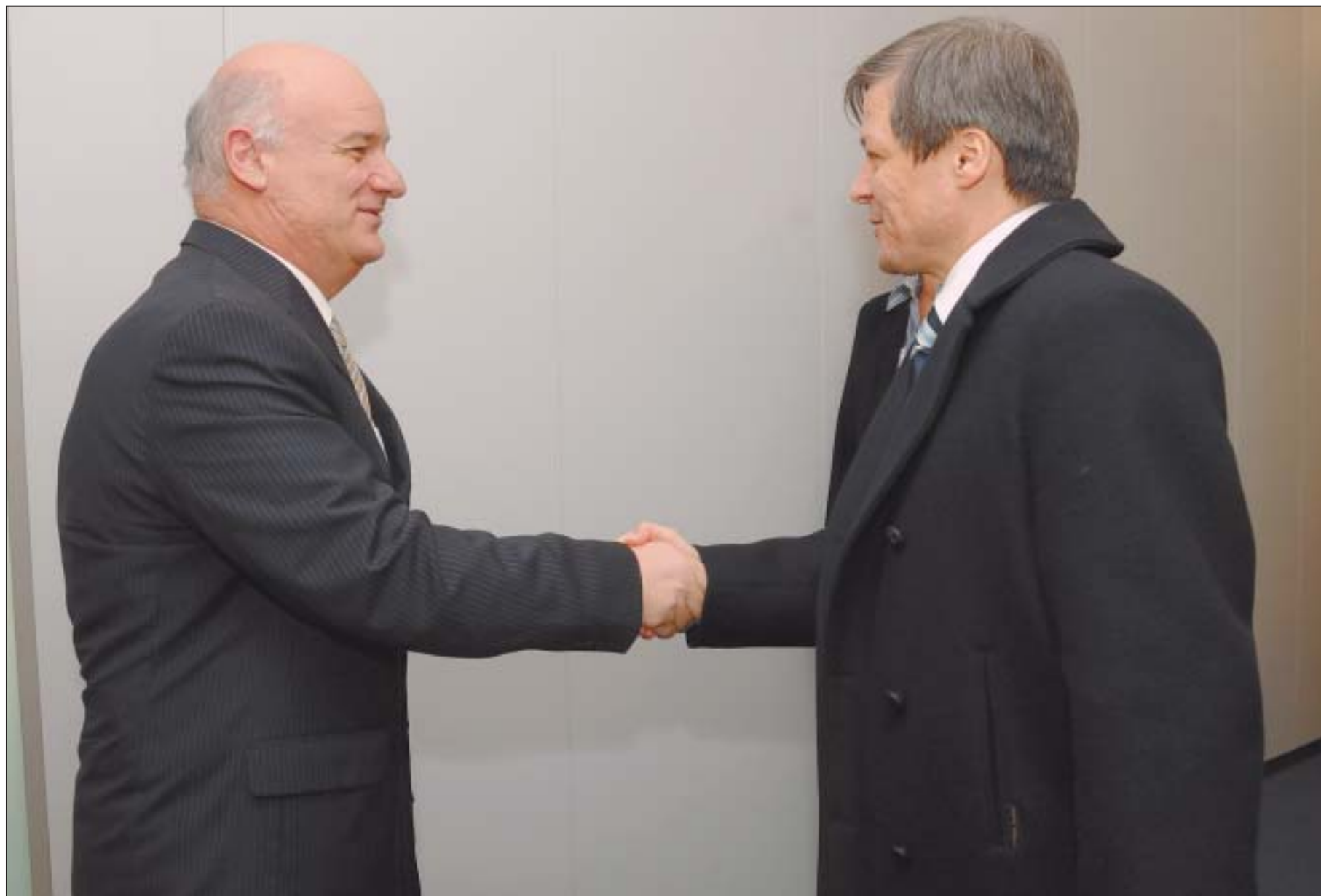
Dacian Cioloș, ministrul român al Agriculturii și Dezvoltării Rurale, împreună cu Joe Borg, comisar european pentru Pescuit și Afaceri Maritime

Se va sprijini menținerea agriculturii de subsistență în zonele de munte și în alte zone defavorizate, în vederea